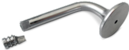
Рис. 1 Поломка от воздействия силы возле канавки

Очень часто после ремонта головки блока цилиндров и кратковременной эксплуатации наблюдается поломка клапана в области клиньев клапана (рис. 1). Это касается в первую очередь клапанов с диаметром стержня 7 мм и менее.